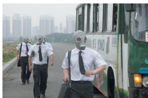
”Чёрный завтрак» Чжан Кэ Цзя