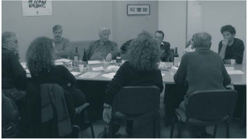
© Dominique Gonzalez-Foerster & Ange Leccia : Des films à faire

La Déclaration universelle des Droits de l'Homme affirme que « Toute personne a le droit de prendre part librement à la vie culturelle de la communauté »; ceci implique que nul n'a le droit de dominer, de diriger ou de supprimer une culture, ni celui d'imposer sa propre culture à autrui.