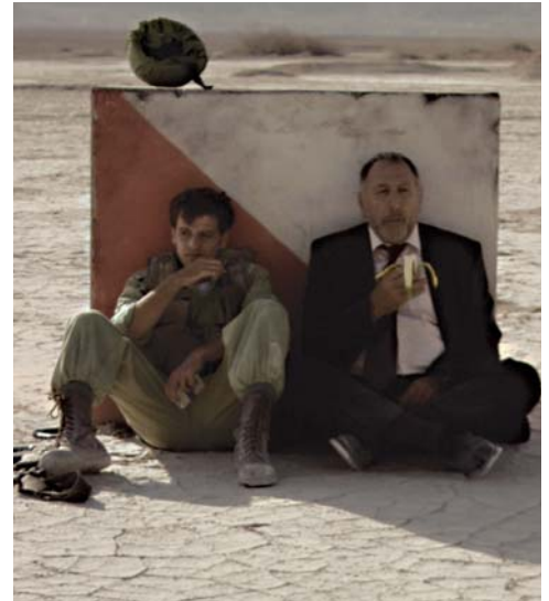
© Shira Geffen & Etgar Keret : What About Me?