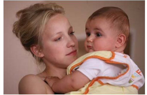
© Sergei Bodrov : The Voice