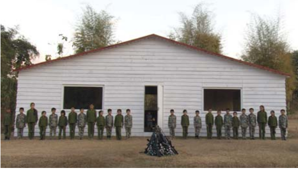
© Marina Abramovic : Dangerous Games