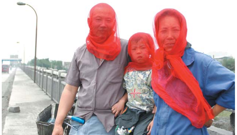
© Jia Zhang-Ke : Black Breakfast

L'environnement n'est jamais mentionné spécifiquement dans la Déclaration universelle des Droits de l'Homme. Cependant, si vous jetez des déchets toxiques là où vit une communauté, ou si vous exploitez ses ressources naturelles de manière exagérée sans consultation ni compensation, vous bafouez ses droits. Depuis soixante ans, notre prise de conscience relative à la dégradation de l'environnement s'est accrue, de même que la certitude que les changements dans notre écosystème peuvent avoir un impact important sur notre capacité à profiter pleinement de nos droits humains. Il est devenu particulièrement évident que les actions des nations, des communautés, des entreprises et des individus peuvent dans ce secteur affecter profondément les droits d'autrui ; en effet, porter atteinte à l'environnement peut nuire au droit des peuples, et à une vie sûre et saine, que ce soit tout près de nous ou plus loin.