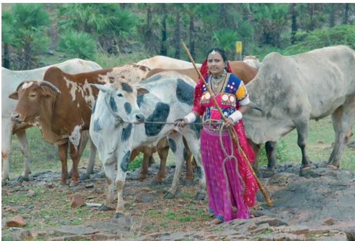
© Murali Nair : The Crossing

Un film mais aussi un livre pour marquer l'universalité de la Déclaration universelle des Droits de l'Homme, en collaboration avec la maison d'édition ELECTA.