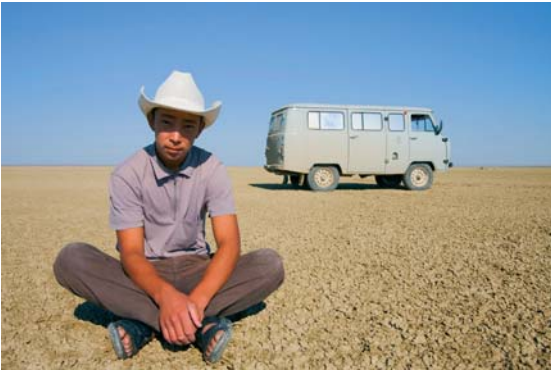
© Francesco Jodice : A Water Tale Kazakhstan