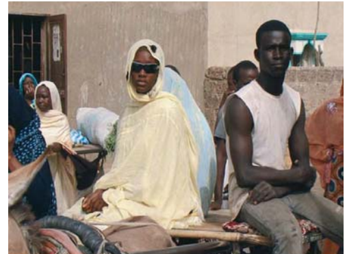
© Abderrahmane Sissako : NDimagou (Dignité)

Le projet Histoires de Droits de l'Homme , dialogue d'images et de textes inspirés par la Déclaration universelle des Droits de l'Homme, est né d'une initiative du Haut Commissaire des Droits de l'Homme. Sa production a été confiée à l'organisation non gouvernementale ART for The World, qui en est aussi le commissaire.