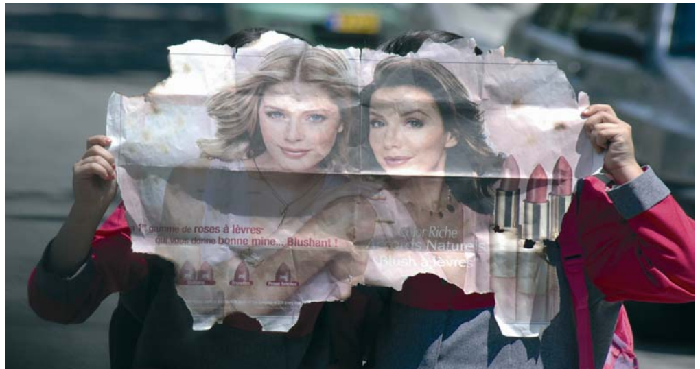
© Saman Salour : The Final Match