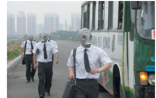
Black Breakfast (petit déjeuner noir) par Zhang Ke Jia