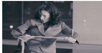
Glass Ceiling (plafond de verre) par Teresa Serrano