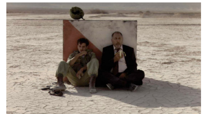
What about Me? (Et moi ?) par Shira Geffen et Etgar Kerret