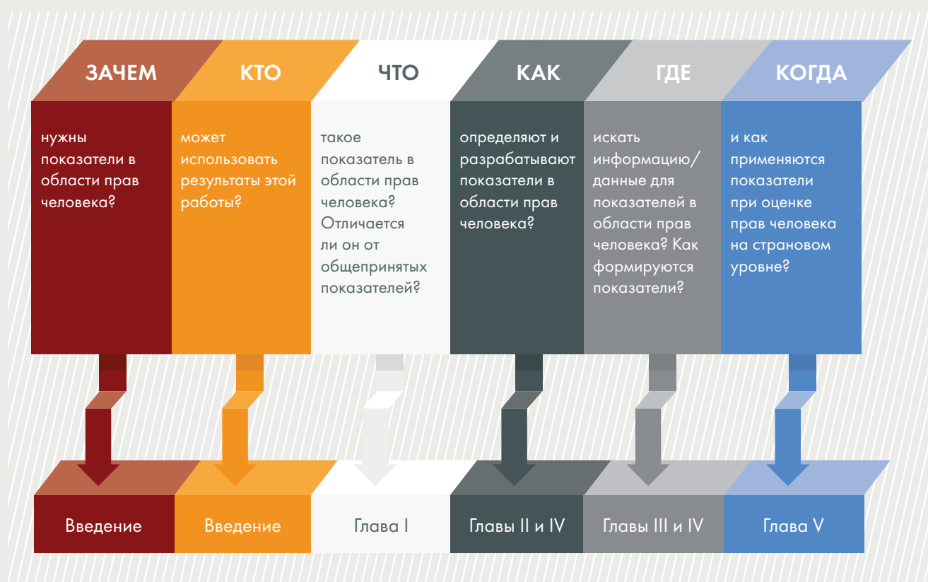
Рисунок II Структура Руководства

В Главе IV представлен анализ на основе этого подхода с выбором отдельных показателей и созданием таблиц с иллюстративными показателями по разным правам человека. Приложение I, где представлены метаданные по нескольким показателям, является неотъемлемой частью этой главы. Метаданные помогают разъяснить методологические (и некоторые концептуальные) вопросы применения показателей при проведении оценки прав человека на национальном уровне. Заключительная глава посвящена элементам возможного подхода к созданию национальной системы мониторинга прав человека. В ней говорится о потенциальном использовании подхода и установленных показателей, например, для последующего контроля за выполнением заключительных замечаний договорных органов и укрепления значимых процессов в области развития, включая бюджетирование и мониторинг выполнения программ с точки зрения прав человека. Кроме того, в ней говорится о выявлении заинтересованных сторон и их привлечении для создания объединений с целью реализации прав человека на локальном уровне. Также Руководство содержит глоссарий. Ниже представлена структура Руководства (рисунок II).