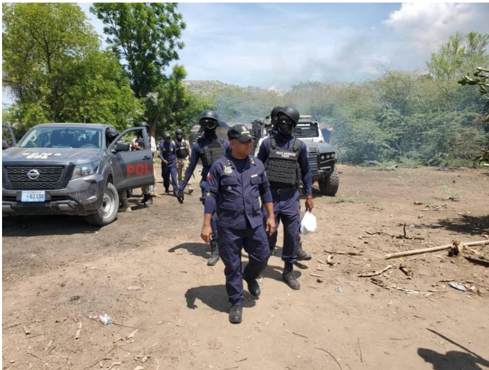
Des policiers dans une ville de la région de l'Artibonite, le 27 avril 2023

En juin 2023, lors d'une rencontre avec le SDH, les responsables de la PNH dans l'Artibonite, malgré la présence de ces différentes unités, estimaient ne pas disposer des moyens opérationnels et humains nécessaires pour rétablir l'ordre et démanteler les gangs. Aussi, la police s'est contentée de mener des patrouilles sur les principales routes de la vallée de l'Artibonite et de se positionner à des carrefours stratégiques au cours de la journée. À la fin du mois d'août 2023, le Directeur de la Police départementale de l'Artibonite a été remplacé. Il avait été nommé en janvier 2023, suite à l'attaque sur les policiers à Liancourt, son prédécesseur ayant été suspendu de ses fonctions et affecté à la Direction générale de la PNH.