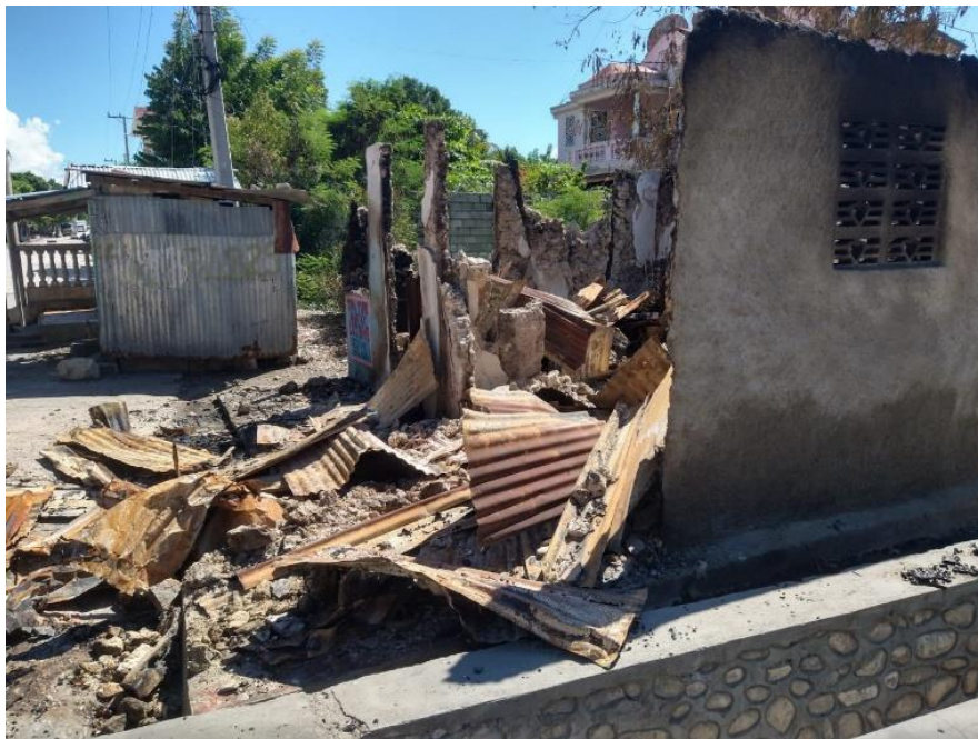
Une des nombreuses maisons détruites le 22 octobre, lors d'une attaque des membres du gang Grand Grif contre le centre-ville de la commune de Petite Rivière de l'Artibonite.

En plus des destructions perpétrées par les gangs, le SDH a aussi documenté des destructions impliquant des personnels de la PNH, sous le contrôle d'un commissaire de police basé au commissariat des Gonaïves. Au cours des mois de mai et juin 2023, dans la localité de Joanis (commune de Petite Rivière de l'Artibonite), une série d'opérations policières, accompagnées d'un groupe d'autodéfense arrivant de Kapenyen (commune de l'Estère), ont vandalisé et brûlé au moins une centaine d'habitations, sous prétexte de rechercher des membres du gang Kokorat San Rat qui au demeurant ne résident pas dans cette zone. Ces destructions avaient, entre autres, pour but de chasser les résidents et prendre le contrôle de cette zone. D'ailleurs, à la suite de cet incident, plus de 370 familles ont été obligées de se déplacer et trouver refuge dans les villes des Gonaïves, Gros Morne et Saint Marc.