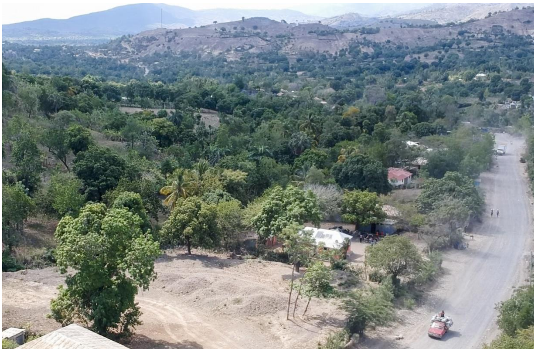
Gros Morne, commune du département de l'Artibonite

Cette région, susceptible d'exercer une pression politique et économique sur la capitale et l'ensemble du pays, a connu dans son histoire différentes formes de violence. Elle a aussi été à l'origine de mouvements contestataires qui ont déstabilisé le pouvoir en place, en particulier en 1986 contre Duvalier, puis en 2004 contre Aristide.