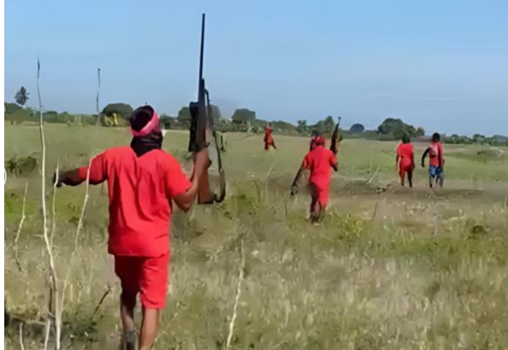
Membres du gang Gran Grif